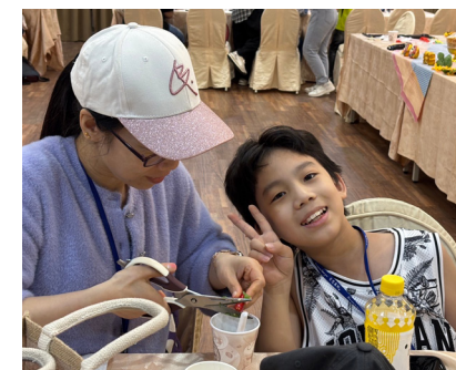
Parent-child activity Parent-child activity. Detective mission

In many families of new residents, mothers often become the main force in parent-child activities, taking their children to participate, while fathers are often absent from these family times because they are busy with work. To change this, we have specially designed activities full of adventure and puzzle elements, hoping to encourage fathers to get out of the busy life of work and create more beautiful memories with their families.