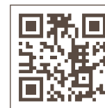
官方網站 Official website

EMAIL: hsfs2011@gmail.com Official website: http://www.hsfs.org.tw/